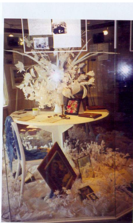
Экспозиция Дома-музея М. и А. Цветаевых в Александрове

Это самый известный пример. Комната решена в белом цвете. одна из стен закрыта зеркалом. К зеркалу приставлено половинка стола и половинка вазы с цветами. Зеркало воссоздает иллюзию цельности этих объектов.