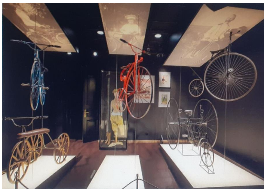
Рис. 5. Историко-культурный проект «Государевы потехи». Зал «Императорские велосипеды».

Келесі мысалда бейненің тұтастығын көруге болады, егер зат ықшамды ғана көрсетілсе, экспозиция кеңістігі жүктелмейді, дизайн тұрғысынан өте жақсы орналастырылған және бәрі бір идеяға қызмет етеді.