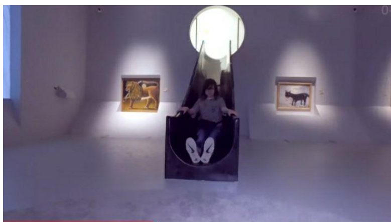
Выставка «Игра с шедеврами» в Еврейском музее (2019)

"Шедеврлер ойыны" көрмесінде бейнелеу, драматургия, ерекше архитектура, көркемдік шешім, аттрактивтілік, интерактивтілік және экспрессивтілік бар. Сондай-ақ, жаңа мультимедиялық технологиялар қолданылды.