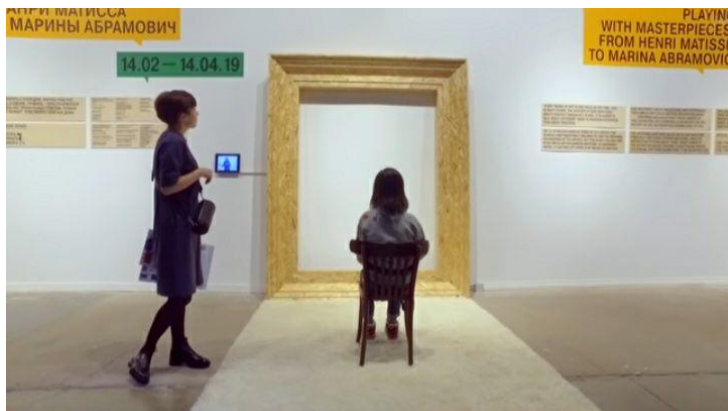
Выставка «Игра с шедеврами» в Еврейском музее (2019) / Oh My Art

https://www.youtube.com/watch?v=EjJzylwONYU&t=725s