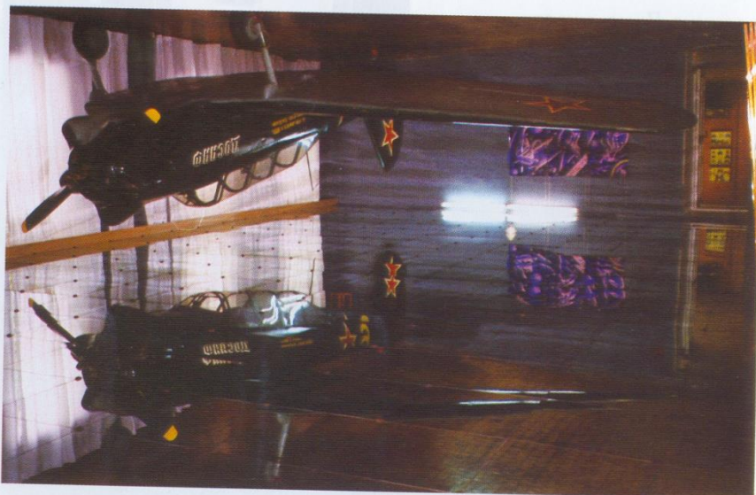
Самолет, на котором учился летать Ю.А. Гагарин в зале с зеркальным потолком в Саратовском областном краеведческом музее

Келесі мысалда бейненің тұтастығын көруге болады, егер зат ықшамды ғана көрсетілсе, экспозиция кеңістігі жүктелмейді, дизайн тұрғысынан өте жақсы орналастырылған және бәрі бір идеяға қызмет етеді.