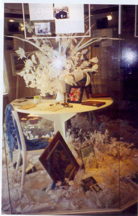
Экспозиция Дома-музея М. и А. Цветаевых в Александрове

Бұл ең танымал мысал. Бөлме ақ түске боялған. қабырғалардың бірінде айна ілінген. Айнаға үстелдің жартысы және гүлдері бар вазаның жартысы бекітілген. Айна осы объектілердің тұтастығы туралы иллюзия береді.